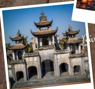
Cathédrale de Phat Diem